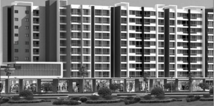
3-D VIEW OF PROJECT IS ARTIST CONCEPTION AND MAY NOT BE ACTUAL PART OF BUILDING.

इन्दौर विकास प्राधिकरण की आनन्द वन फेज़ 2, योजना क्रमांक 140 में आवासीय फ्लैट खरीदने हेतु पूनियन बैंक ऑफ इण्डिया की प्राधिकरण भवन शाखा तथा आय.सी.आय.सी.आय. बैंक इन्दौर की मालव परिसर शाखा से (बैंक कार्यालयीन समय में) ₹590 (जी.एस.टी. सहित) जमा कर फार्म ले सकते हैं। प्राधिकरण की वेबसाइट से डाउनलोड किए फॉर्म के साथ ₹590 (जी.एस.टी. सहित) का बैंक ड्राफ्ट पृथक से संलग्न कर आवेदन प्रपत्र के साथ जमा करना होगा। आवेदन प्रपत्र के साथ पंजीयन राशि का बैंक ड्राफ्ट आवश्यक रूप से संलग्न करना होगा।