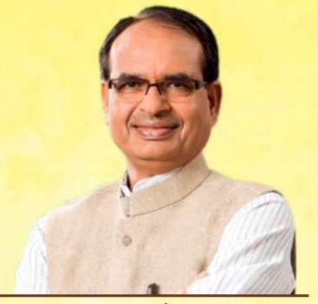
श्री शिवराज सिंह जी चौहान मान. मुख्यमंत्री (मध्यप्रदेश)